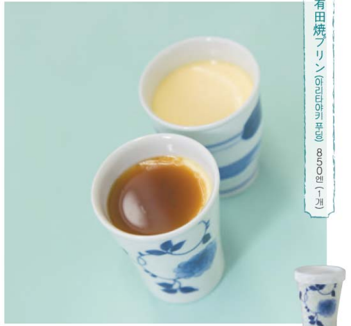
有田焼プリン(아리타야기 푸딩) 850원 (1개)

【판매】 다카시마토후텐 니시마쓰우라군 아리타초 이와 야가와치 2-9-7 ☎0955-43-2463 7:00~17:00 휴점:없음/ 주차:없음 / 판매점:다카시마 토후텐(*아마우치공장에서 도 판매)등