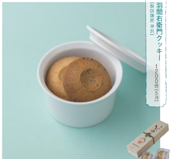
羽間右衛門クッキー (하마에몬 쿠키) 1200원 (5개)

【販売】 마에다 도스케토 사가현 니시마쓰우라군 아리 타초이즈미야마 16-12 ☎0955-42-4411 11:00~20:00 휴점:부정기적 / 주차:없음 판매점:마에다 도스케토 / 아 리타역 앞 아리타이치방칸