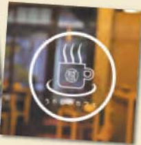
시블트노유 근처에 2013년 10월에 открыт. 꼭 둘러보자.