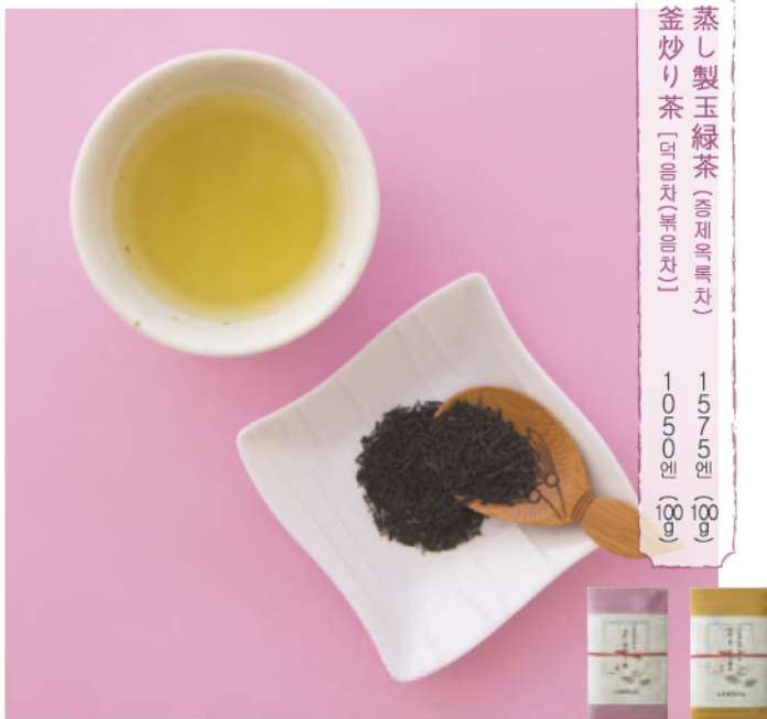
蒸し製玉緑茶 (증제옥록차) 1575엔 (100g) 釜炒り茶 (포아차/볶음차) 1050엔 (100g)

【판매】료칸오무라야 사가현우레시노시우레시노 마치오아자시모즈쿠 848 ☎0954-43-1234 8:00~22:00 휴점:부정기적 / 주차:있음 / 판매점:료칸오무라야