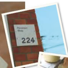
상품 하나 하나에 마음을 담아 만들어 낸다.