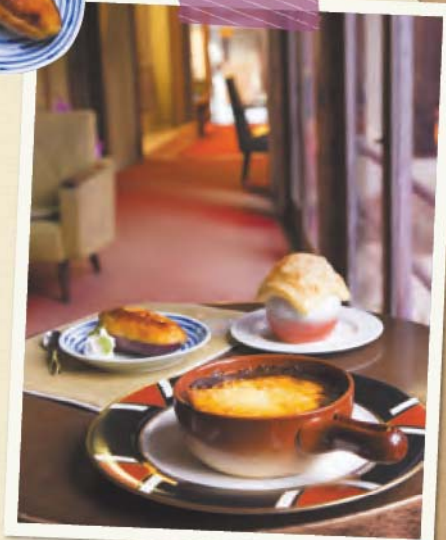
야키카레 600엔, 파이프프미스프 450엔, 스위트포테이토 360엔