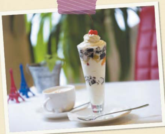
커피젤리 소프트 550엔 비엔나커피캐러멜 450엔