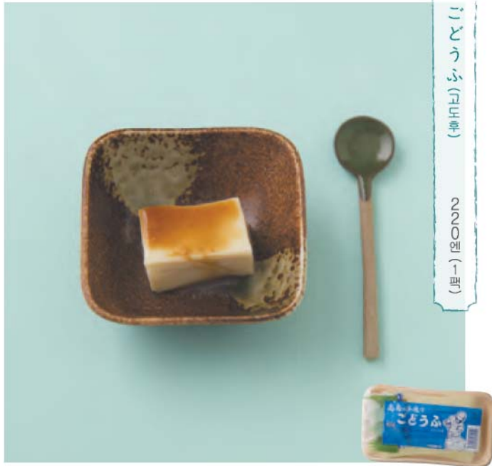
こどうふ(もち) (후) 2200원 (1개) (후)

탱글탱글함과 쫄깃한 식감에 자꾸만 손이 간다. 전통 제조법으로 만든 '고도후'는 참깨간장양념이나 흑설탕 소스를 뿌려서 간식으로도 즐길 수 있다.