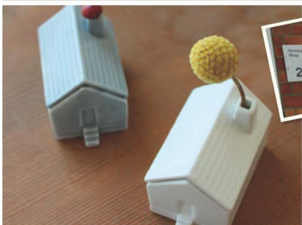
꽃을 골뎀에 꽂을 수 있는 'house of flower'. 사랑스러운 작은 집 모양의 꽃병이다. 지붕 부분을 분리할 수 있다.