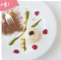
녹지 않는 젤라토 풍의 두부 세미프레도 580엔