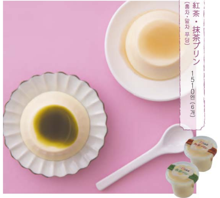
紅茶・抹茶プリン (홍차·말차 푸딩) 1510엔 (6개)

【판매】하시즈메카시호 사가현우레시노시우레시노 마치오아자시모즈쿠 937-1 ☎0954-42-1063 8:00~19:30 휴점:수요일/ 주차:없음 / 판매점:하시즈메 카시호/ 다이쇼야 매점 / 마쓰엔 등