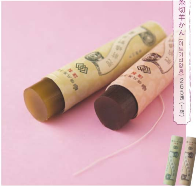
糸切羊かん (이토키리양갱) 265엔 (1팩)

‘우레시노’하면 떠오르는 녹차. 그 녹차를 사용한 에스러운 먹거리를 집에서도 느껴보자.