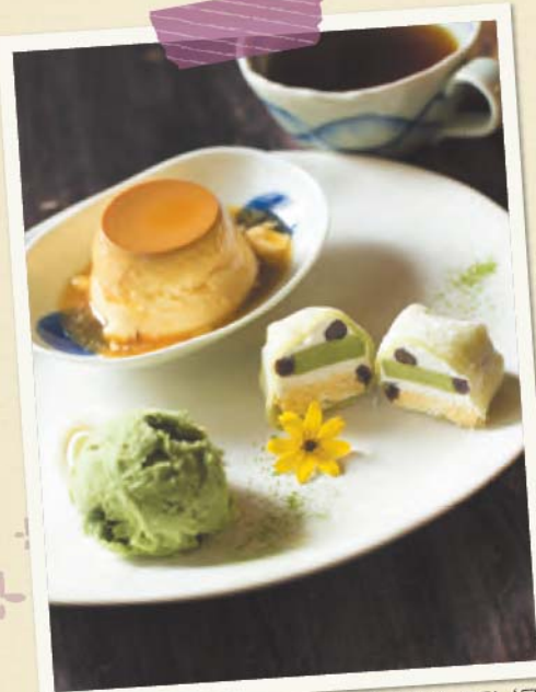
한 입 크기의 찰쌀떡과 쫄깃쫄깃한 식감의 푸딩, '모치 푸링 세트'가 900엔. (*포장용도 있음)

우레시노에는 맛있는 것들이 가득하다! 차와 디저트, 두부요리 등 여자들을 위한 기쁜 소식!