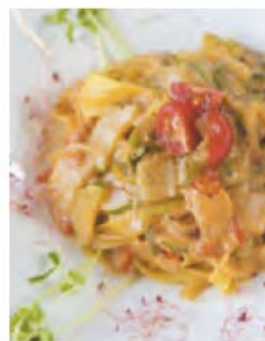
겨울 한정 가리비와 주키 니 탈리아텔레 1000엔