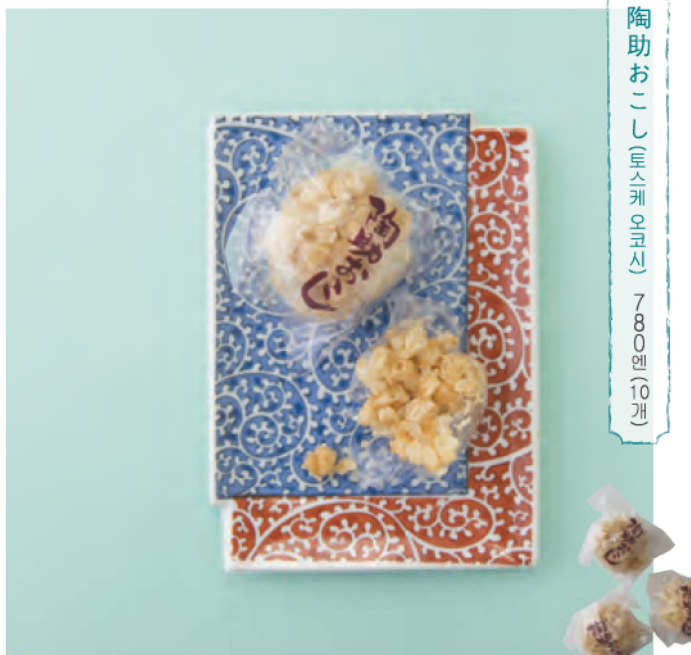
陶助おこし(도스케오코시) 780원 (10개)

【판매】 안보쥬루 사가현 니시마쓰우라군 아리 타초마루오해이 1933-1 ☎0955-41-1122 10:00~20:00 휴점:수요일 / 좌석: 4-8석 / 주차:6대 / 판매점:안보쥬루