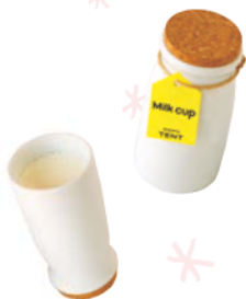
우유병을 꼭 빼놓은 'milk cup'