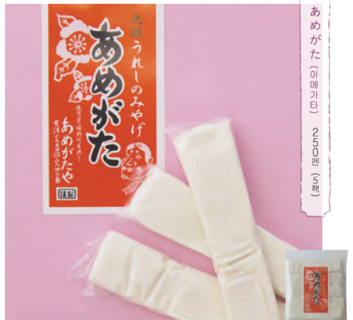
あめがた (아메가타) 250엔 (5팩)

【판매】나가오세이차통야 사가현우레시노시우레시노 마치오아자시모즈쿠해이98-1 ☎0954-42-0523 9:00~18:00 휴점:부정기적 / 주차:있음 판매점:나가오세이차통야